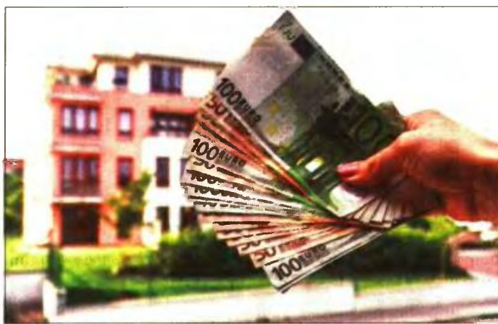
Αιτήσεις έως 31 Οκτωβρίου μπορούν να υποβάλλουν «κόκκινοι» δανειολήπτες, αλλά και ενήμεροι που έχουν δάνειο με υποθήκη την α' κατοικία

■ Μέσα σε 58 ημέρες υποβλήθηκαν 131.155 αιτήσεις, αν και το υπουργείο υπολόγιζε ότι θα ενταχθούν περίπου 300.000 δανειολήπτες