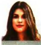
ΤΗΣ ΘΥΓΗΣ ΣΑΛΙΟΤΟΥ

Τι θα περιλαμβάνει η μεταρρύθμιση για το ΑΣΕΠ που πρόκειται να φέρει στη Βουλή τον επόμενο μήνα το υπουργείο Εσωτερικών