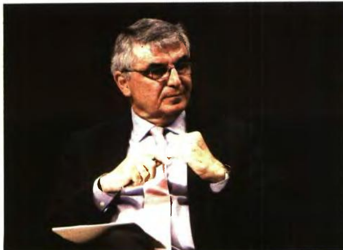
Ο Πάνος Τσακλόγλου προχωράει τη μεταρρύθμιση του Ασφαλιστικού.

Από την άλλη, στο υπουργείο Εργασίας υπολογίζουν ότι τα προσεχή χρόνια θα είναι μικρότερος ο αριθμός των ατόμων που θα βγουν σε σύνταξη και αυτό γιατί τα προηγούμενα χρόνια αξιοποιήθηκαν από τους εργαζομένους ευνοϊκές διατάξεις που υπήρχαν στον Νόμο Κουτρουμάνη. Δεν παραγνωρίζουν, βεβαίως, ότι οι συντάξεις λόγω του Νόμου Κατρούγκαλου είναι αισθητά μειωμένες, κάτι που θεωρούν ότι θα τους απασχολήσει το προσεχές διάστημα. Από εκεί και πέρα, το ενδιαφέρον τους έγκειται και στο μεγάλο ζήτημα της ταχύτερης απονομής συντάξεων. Προϋπόθεση για να συμβεί αυτό είναι να υπάρχουν όλα τα ένσημα των εργαζομένων σε ψηφιοποιημένα αρχεία και κανόνες γραμμένοι σε υπολογιστές. Αν συμβεί αυτό, που κατά γενική ομολογία είναι δύσκολο εγχείρημα, οι συντάξεις θα βγαίνουν ταχύτερα.