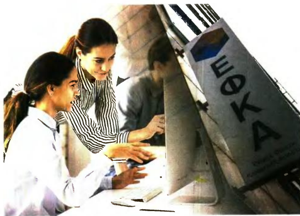
Το μόνο «βέβαιο» στοιχείο των σχεδιαζόμενων αλλαγών στην επικουρική ασφάλιση είναι πως θα αφορούν υποχρεωτικά τους νέους εργαζομένους.

Τέλος, στην ίδια έκθεση νοείται πως «συμπληρωματικά προς την παραπάνω κατεύθυνση, είναι ιδιαίτερα σημαντική η θέσπιση αποτελεσματικού και αυστηρού κανονιστικού πλαισίου για τα ασφαλιστικά ταμεία στον δεύτερο και τρίτο πυλώνα κατά τα πρότυπα πολλών χωρών της Ε.Ε., όπως και η λειτουργία ενός