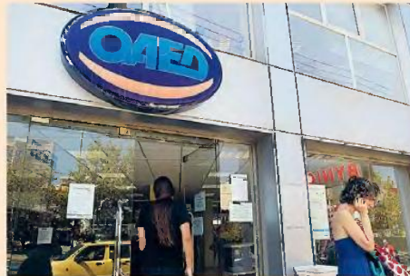
Με εργαλεία των ΟΑΕΔ και το «Εργάνη», το πρόγραμμα για την επιδότηση των ασφαλιστικών εισφορών αναμένεται να ξεκινήσει άμεσα.

πρόνοια του προγράμματος θα είναι η διατήρηση του ίδιου αριθμού εργαζομένων και στο πρόγραμμα θα μπορούν να συμμετάσχουν όλες οι επιχειρήσεις ανεξάρτητα από το εάν ανήκουν σε κάποιον από τους ΚΛΔ που αναγνωρίζει ως πληττόμενους το υπουργείο Οικονομικών ή έστω την πτώση του τζίρου τους κατά τη διάρκεια της πανδημίας. Η επικορήγηση θα αυξάνεται κατά 200 ευρώ τον μήνα στην περίπτωση που η πρόσληψη θα αφορά μακροχρόνια άνεργο. Σύμφωνα με τον υπουργό Εργασίας Γιάννη Βρούτση, με