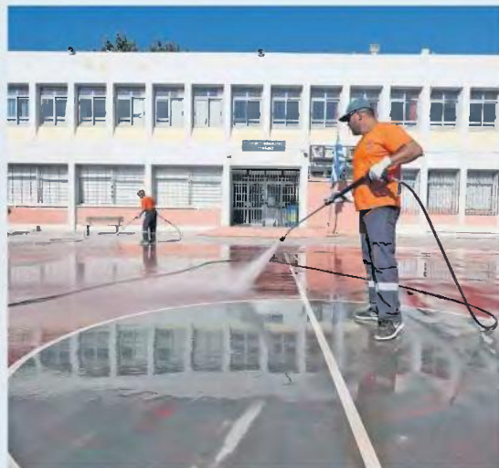
Σε περίπτωση που κάποιος μαθητής ή κάποιος εκπαιδευτικός εμφανίσει συμπτώματα θα μεταφέρεται άμεσα σε καλά αεριζόμενο χώρο και θα φοράει μάσκα. Μετά την απομάκρυνσή του, ο χώρος θα καθαρίζεται.