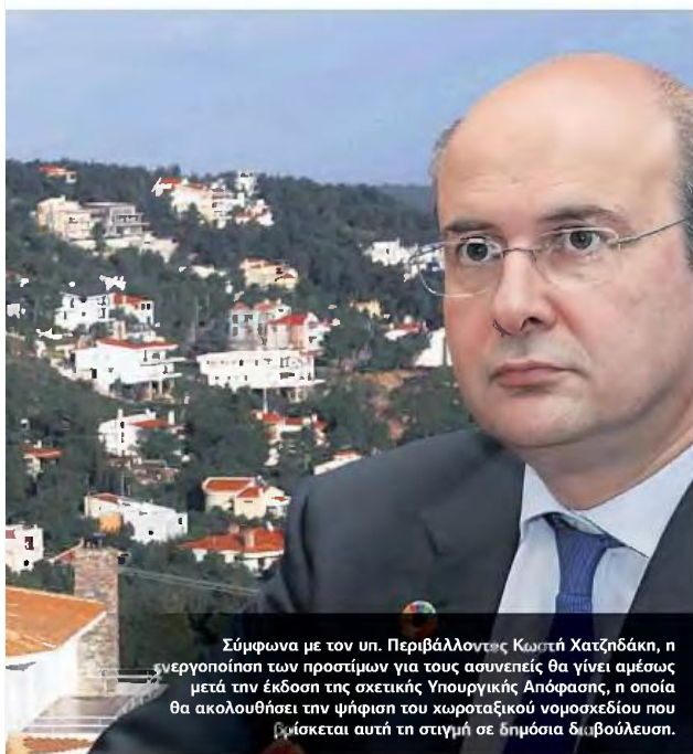
Σύμφωνα με τον υπ. Περιβάλλοντος Κωστή Χατζηδάκη, η ενεργοποίηση των προστίμων για τους ασυνεπείς θα γίνει αμέσως μετά την έκδοση της σχετικής Υπουργικής Απόφασης, η οποία θα ακολουθήσει την ψήφιση του χωροταξικού νομοσχεδίου που βρίσκεται αυτή τη στιγμή σε δημόσια διαβούλευση.

ΕΛΕΥΘΕΡΟΣ ΤΥΠΟΣ ΠΕΜΠΤΗ 3 ΣΕΠΤΕΜΒΡΙΟΥ 2020