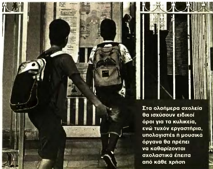
Στα ολοήμερα σχολεία θα ισχύσουν ειδικοί όροι για τα κυλικεία, ενώ τυχόν εργαστήρια, υπολογιστές ή μουσικά όργανα θα πρέπει να καθαρίζονται σχολαστικά έπειτα από κάθε χρήση

Ισχύει βέβαια και εδώ η χρήση της μάσκας μέσα στις αίθουσες των σχολείων, στους διαδρόμους, σε κάθε κλειστό χώρο, καθώς και σε ανοικτούς χώρους μόνο όπου υπάρχει συγχρωτισμός. Εάν μαθητές ή μαθήτριες δεν τη φορούν, το υπουργείο Παιδείας έχει ζητήσει να επιβάλλονται «ποινές» όπως το να μη γίνονται δεκτοί στις τάξεις και να παίρνουν απουσία. Κατά τη διάρκεια του φαγητού και του παιχνιδιού σε ανοικτό χώρο η μάσκα δεν είναι υποχρεωτική.