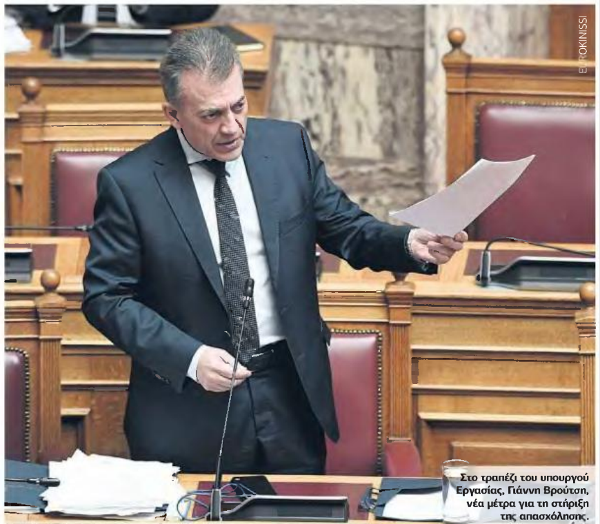
Στο τραπέζι του υπουργού Εργασίας, Γιάννη Βρούση, νέα μέτρα για τη στήριξη της απασχόλησης.