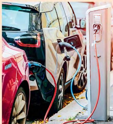
Δίνεται προαιρετικά η δυνατότητα απόσυρσης παλαιού οχήματος, το οποίο έχει ταξινομηθεί στην Ελλάδα από την 1.1.2013.

την 1η Ιανουαρίου 2020. Η απόσυρση αυτοκινήτου επεμβαφύεται με 1.000 ευρώ, ενώ αυτή του δικύκλου με 400 ευρώ. Σύμφωνα με την ανακοίνωση του ΥΠΕΝ, οι ωφελούμενοι δεν μπορούν να επιδοτηθούν μεμονωμένα για την αγορά φορτιστή ή για την απόσυρση παλαιού οχήματος, αλλά μόνον εφόσον επιλέξουν να αγοράσουν ή να μισθώσουν ηλεκτρικό όχημα. Επίσης, εξαιρούνται της απόσυρσης τα ποδήλατα.