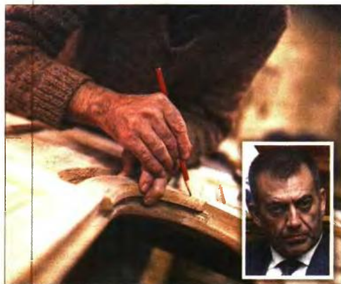
Σε εφαρμογή οι αλλαγές του υπουργού Εργασίας Γιάννη Βρούτση (ένθετη) για τους συνταξιούχους που επιστρέφουν στη δουλειά

Επίσης, η επικουρική σύνταξη αναστέλλεται ή περικόπεται μόνο εφόσον προκύπτει υποχρέωση ασφάλισης στον Κλάδο Επικουρικής Ασφάλισης του e-ΕΦΚΑ (τ. ΕΤΕΑΕΠ). Συνταξιούχοι που είχαν αναλάβει εργασία ή δραστηριότητα πριν από τις 13/05/16 και εξαιρούνταν από την εφαρμογή του άρ. 20 του Ν. 4387/2016 σύμφωνα με ειδικότερες διατάξεις, οι οποίοι εξακολουθούν να εργάζονται, υπάγονται στις διατάξεις του παρόντος από 1/3/2022.