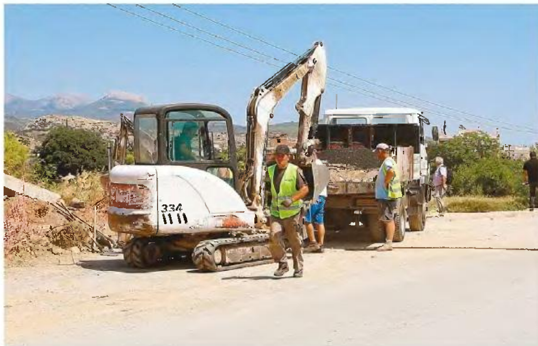
Εργασίες αποκατάστασης στη γέφυρα Βασιλικού, κοντά στη Χαλκίδα.

• Επίσης, το υπουργείο Οικονομικών ανακοίνωσε την αναστολή για 6 μήνες στην πληρωμή όλων των εκκρεμών φορολογικών υποχρεώ-