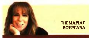
ΤΗΣ ΜΑΡΙΑΣ ΒΟΥΡΓΑΝΑ

Εξαγγελίες από κυβέρνηση μετά το σήμα της Επιτροπής Πισσαρίδη και ποια σενάρια εξετάζει το οικονομικό επιτελείο