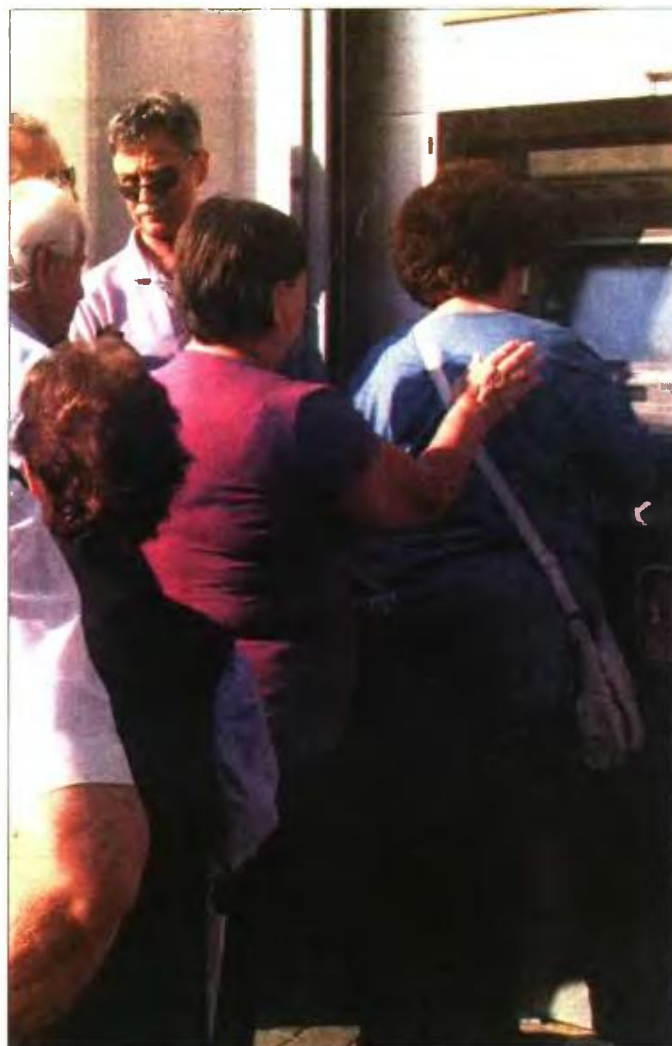
Οι συνταξιούχοι που έλαβαν αναδρομικά του 2013 τα οποία δεν δήλωσαν στη φορολογική δήλωση του 2014 θα φορολογηθούν εκ νέου

1. Να διαγράψουν οριστικά από τους φόρους τις επιβαρύνσεις που λανθασμένα τούς βεβαιώθηκαν από τις ΔΟΥ. Η ακύρωση