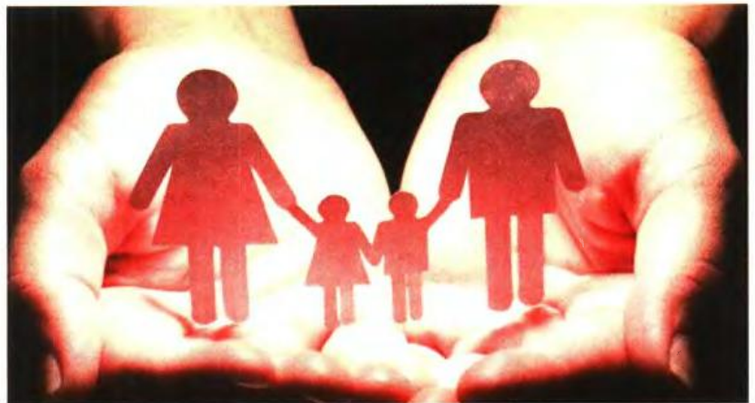
Η οικογένεια αναζητεί σπίτι να νοικιάσει ζητώντας μερικές ημέρες προθεσμία για να καταβάλει το ενοίκιο

«Μόλις βρεθήκαμε στον δρόμο αναζητήσαμε προσωρινή στέγη για να αφήσουμε για λίγες ώρες τα παιδιά και να ψάξουμε για σπίτι. Πού θα μέναμε; Στον δρόμο;», περιγράφει τη σκληρή πραγματικότητα με την οποία ήρθε αντιμέτωπος από τη μία στιγμή στην άλλη. «Το μεγαλύτερο παιδί μας έκλαιγε συνεχώς. Βίωσε την κατάσταση της έξωσης και ήταν φοβισμένο», συνεχίζει. «Οκτώ ώρες περιπλανιόμασταν. Όλοι ζητούσαν προκαταβολή. Τους εξηνούσα ότι σε λίγες ημέρες πληρώνομαι και θα τους δώσω τα χρήματα. Κανείς δεν δεχόταν», αναφέρει. Η «Οδύσειά» τους τους έφερε στο κατάφλη υπηρεσιών της ΚΕΚ-ΠΑ ΔΙΕΚ και μέσω της προέδρου Νατάσσας Μορφολιάννη δρομολογήθηκαν οι διαδικασίες προσωρινής φιλο-