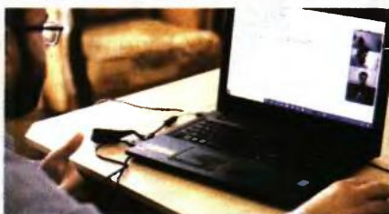
Ο εργοδότης υποχρεούται να καλύπτει το κόστος του εξοπλισμού και τη συντήρησή του. Εντός 8 ημερών από την έναρξη της τηλεργασίας, ο εργοδότης υποχρεούται να γνωστοποιήσει εγγράφως προς τον εργαζόμενο τα λεπτομερή καθήκοντά του, το ωράριο εργασίας κ.λπ.

▼ Στο ίδιο νομοσχέδιο αναφέρεται να συμπληρωθεί και δέσμη ρυθμίσεων για την τηλεργασία, ενώ ιδρύεται αυτοτελής Τμήμα Ελέγχου της Τηλεργασίας στο Σώμα Επιθεώρησης της Εργασίας. Οι προωθούμενες διατάξεις αναφέρουν πως η εφαρμογή τηλεργασίας συμφωνείται μεταξύ εργοδότη και εργαζόμενου κατά την πρόσληψη ή με μεταγενέστερη συμφωνία, ενώ προβλέπουν και τη δυνατότητα μονομερούς προσφυγής του εργοδότη στο σύστημα της τηλεργασίας σε περίπτωση κινδύνου δημόσιας υγείας. Αντίστοιχα ο εργοδότης οφείλει να αποδεχθεί την πρόταση του εργαζόμενου για τηλεργασία, για λόγους δημόσιας υγείας ή σε περίπτωση κινδύνου υγείας του εργαζόμενου. Οι εκπρόσωποι των εργαζόμενων πληροφορούνται και γνωμοδοτούν για την εκκατάσταση της τηλεργασίας (μετατροπή εργασίας σε τηλεργασία, δικαίωμα στην αποσύνδεση κ.ά.), όπως προβλέπουν οι διατάξεις περί σοματείων και συνδικαλιστικών οργανώσεων. Σύμφωνα με το νέο θεσμικό πλαίσιο που προωθείται, η τηλεργασία μπορεί να παρέχεται κατά πλήρη, μερική ή εκ περιτροπής απασχόληση, όπως επίσης αυτοτελώς ή ακόμη και σε συνδυασμό με απασχόληση στις εγκαταστάσεις του εργοδότη. Η συμφωνία περί τηλεργασίας δεν θίγει το καθεστώς απασχόλη-