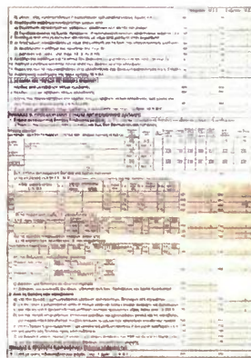
Επιμέλεια ΓΙΩΡΓΟΣ ΛΥΤΙΑΔΗΣ