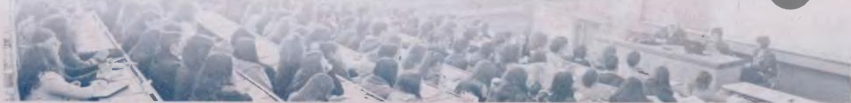
ΤΙΤΗΝ: Αρχή Διασφάλισης και Πιστοποίησης της Ποιότητας στην Ανώτατη Εκπαίδευση (ΑΔΙΠΤ). Επίσημο έκθεση (Σεπτέμβριος 2019). Eurostat

Όλα τα νέα τμήματα του 2019 που δεν έχουν αξιολογηθεί, θα αξιολογηθούν, ενώ θα υπάρξει και μελέτη σκοπιμότητας και βιωσιμότητάς τους.