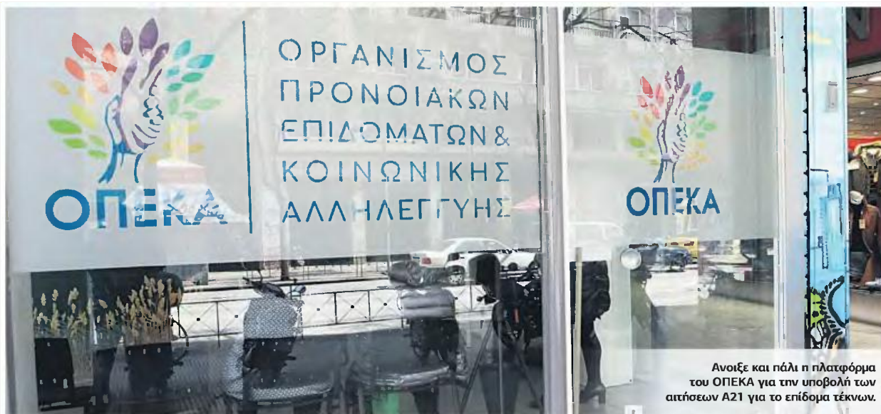
Ανοίξε και πάλι η πλατφόρμα του ΟΠΕΚΑ για την υποβολή των αιτήσεων Α21 για το επίδομα τέκνων.

ΠΛΗΡΩΜΕΣ ΣΤΙΣ 31 ΙΟΥΛΙΟΥ ΓΙΑ ΟΣΟΥΣ ΥΠΟΒΑΛΟΥΝ Α21 ΜΕΧΡΙ ΤΑ ΜΕΣΑ ΙΟΥΛΙΟΥ