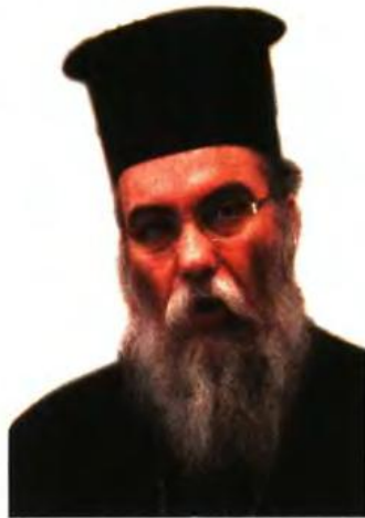
Γράφει ο Σεβ. Μητροπολίτης Κισιάμου και Σελίνου κ. Αμφιλόχιος

Τι συνεπάγεται αυτό πρακτικά, εκτός των άλλων συνεπειών και για την οικονομία; Σή-