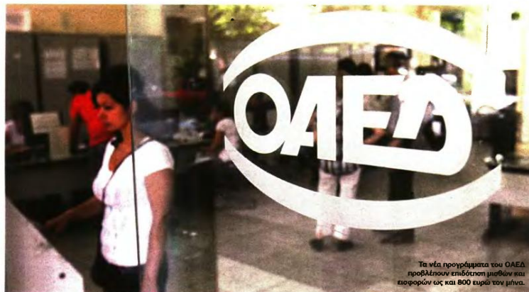
Το νέο πρόγραμμα του ΟΑΕΔ προβλέπει επιδότηση μισθών και εισοδημάτων ως και 800 ευρώ τον μήνα.

ΣΕ ΔΗΜΟΣΙΟ ΚΑΙ ΙΔΙΩΤΙΚΟ ΤΟΜΕΑ 12.000 ΠΡΟΣΛΗΨΕΙΣ ΕΝΟΣ ΕΤΟΥΣ ΜΕ ΕΠΙΔΟΤΗΣΗ 800€ ■ ΣΕΛΙΔΑ 24