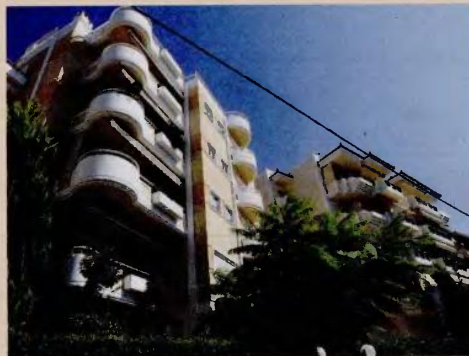
Ο νέος πτωχευτικός νόμος προβλέπει το δικαίωμα ο οφειλέτης να λάβει και στεγαστικό επίδομα από το κράτος για τη μίσθωση της πρώτης κατοικίας του.

να διαμένει στο ακίνητο, την κυριότητα του οποίου θα έχει χάσει, πληρώνοντας ενοίκιο στον φορέα στον οποίο έχει μεταβιβάσει την πρώτη του κατοικία. Η διάρκεια της μίσθωσης ορίζεται σε 12 έτη, ενώ το μίσθωμα που θα καταβάλλει θα ορίζεται με βάση απόδοση που αντιστοιχεί προς το μέσο επιτόκιο στεγαστικού δανείου με κυμαινόμενο επιτόκιο που ίσχυε σύμφωνα με το στατιστικό δελτίο της ΤτΕ, αναπροσαρμοζόμενο με το επιτόκιο αναφοράς της Ευρωπαϊκής Κεντρικής Τράπεζας.