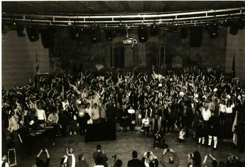
Ⓞ Οι αριστούχοι μαθητές, παιδιά πολύτεκνων οικογενειών που βραβεύτηκαν σε ειδική εκδήλωση, στην αίθουσα τελετών του ΑΠΘ.

η πολύτεκνη οικογένεια στις μέρες μας, πλήττεται πιο σοβαρά από κάθε άλλη κοινωνική ομάδα.