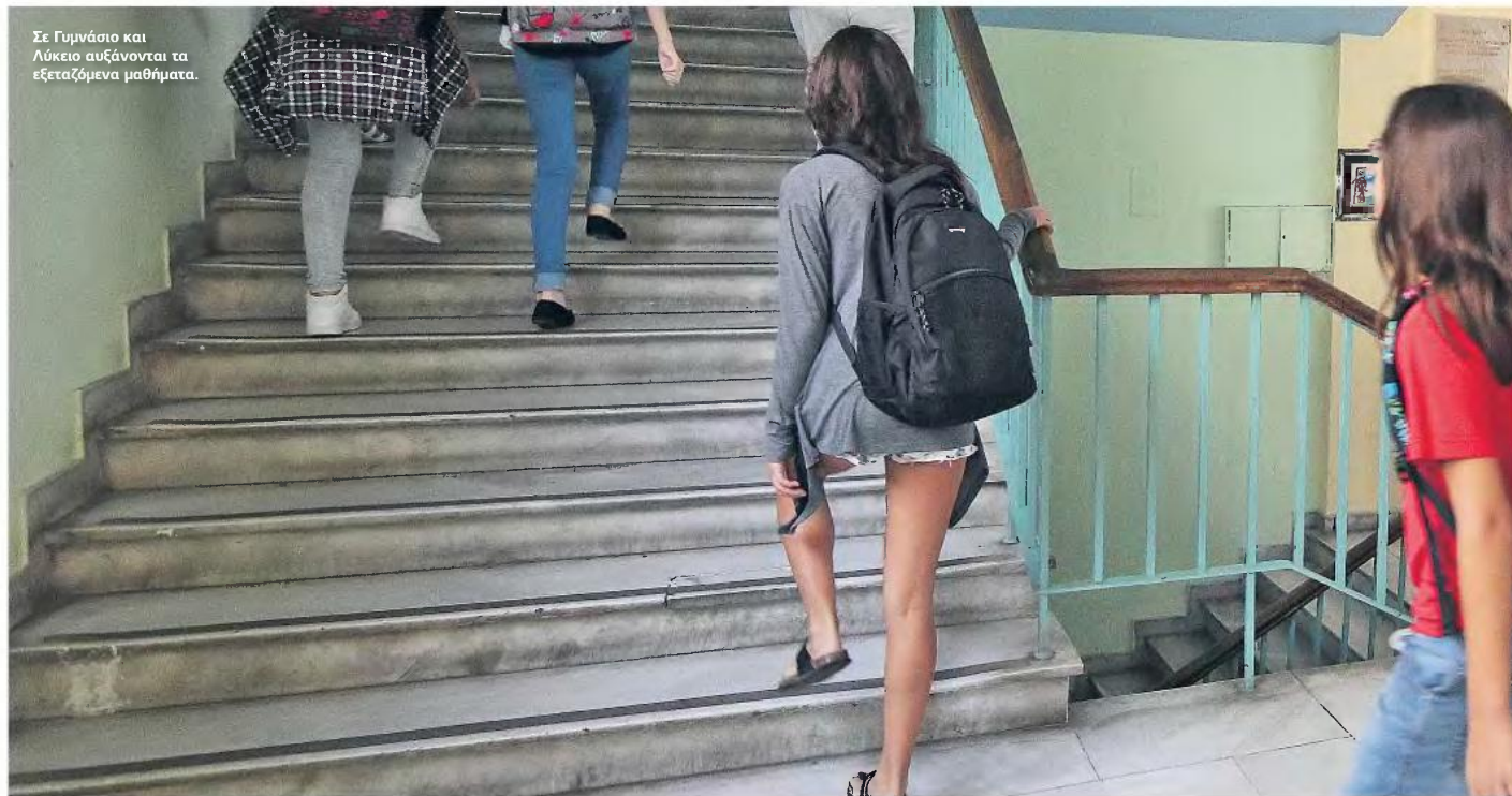
Σε Γυμνάσιο και Λύκειο αυξάνονται τα εξεταζόμενα μαθήματα.

«ΑΝΑΒΑΘΜΙΣΗ ΤΟΥ ΣΧΟΛΕΙΟΥ»: ΟΛΕΣ ΟΙ ΑΛΛΑΓΕΣ ΓΙΑ ΟΛΕΣ ΤΙΣ ΕΚΠΑΙΔΕΥΤΙΚΕΣ ΒΑΘΜΙΔΕΣ ΠΟΥ ΠΡΟΒΛΕΠΟΝΤΑΙ