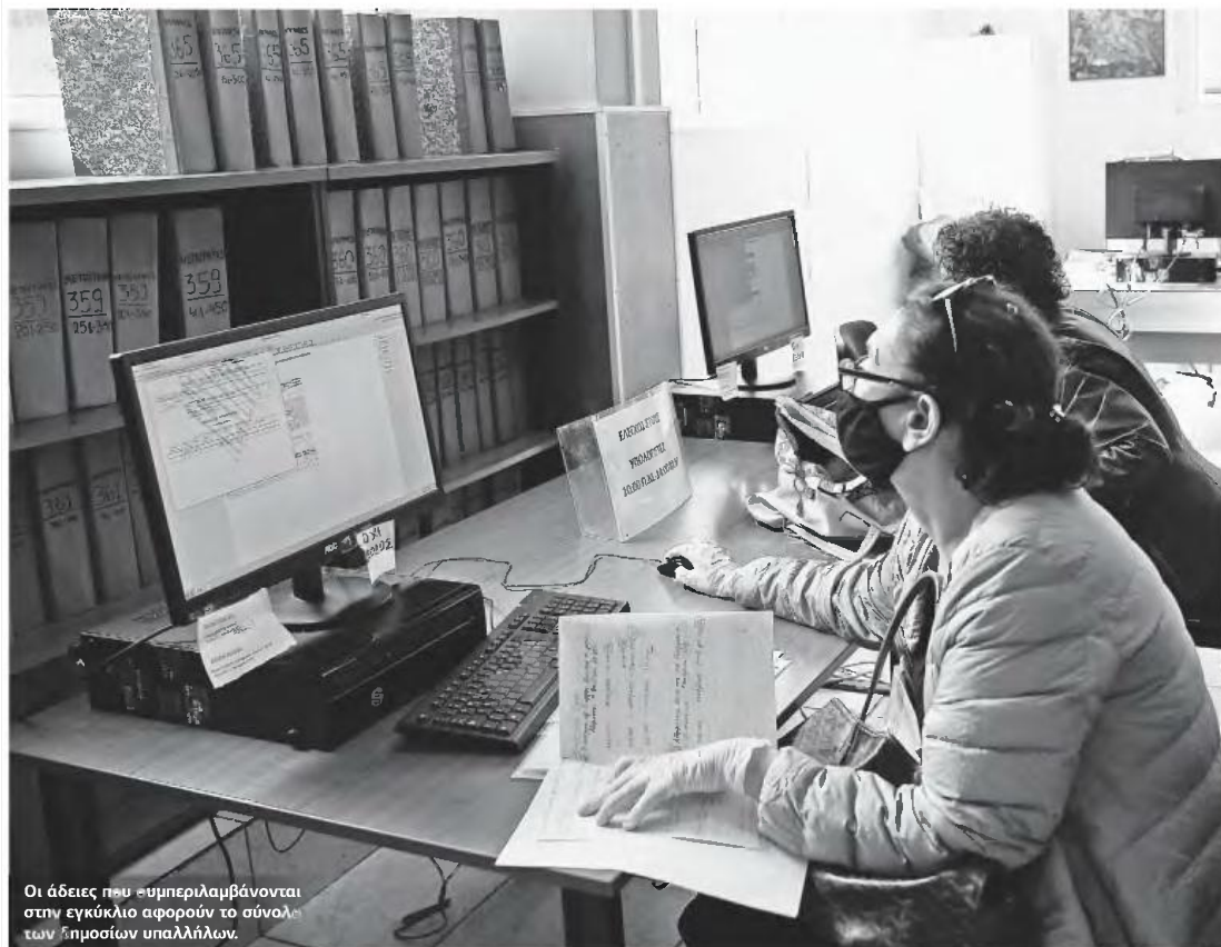
Οι άδειες που συμπεριλαμβάνονται στην εγκύκλιο αφορούν το σύνολο των δημοσίων υπαλλήλων.