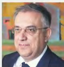
Επιταχύνουν τις διαδικασίες οι υπουργοί Εσωτερικών Παν. Θεοδωρικάκος και Εργασίας Πάννης Βρούτσος

Οι άνεργοι που θα κάνουν αιτήσεις μοριοδοτούνται και με βάση το επίσημο εισόδημα του 2018, ατομικό ή οικογενειακό, ως εξής: