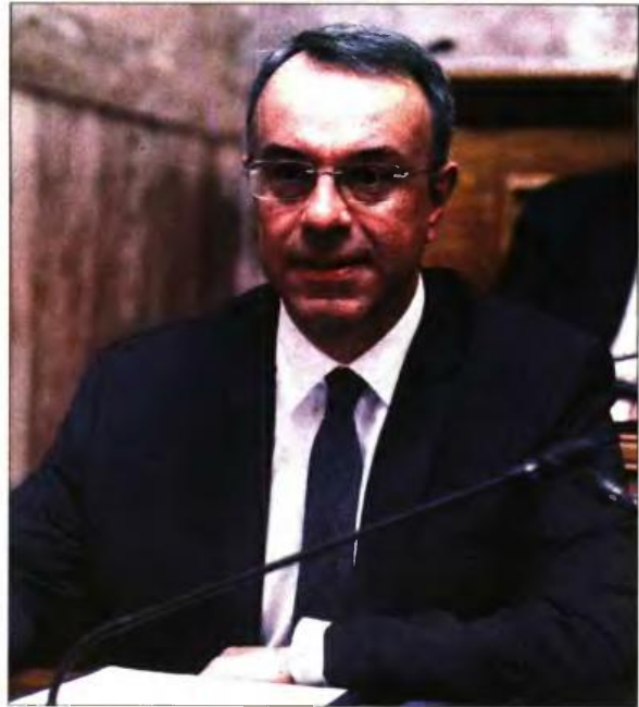
Ο υπουργός Οικονομικών Χρήστος Σταϊκούρας

Φόροι σε αναστολή λόγω κορονοϊού: Πρόκειται για τις φορολογικές υποχρεώσεις Μαρτίου, Απριλίου και Μαΐου που αναστάλθηκαν για τις επιχειρήσεις που έκλεισαν με διοικητική εντολή, στο πλαίσιο των μέτρων περιορισμού της διασποράς του κορονοϊού. Οι υποχρεώσεις αυτές θα πρέπει να εξοφληθούν το δίμηνο Αυγούστου - Σεπτεμβρί-