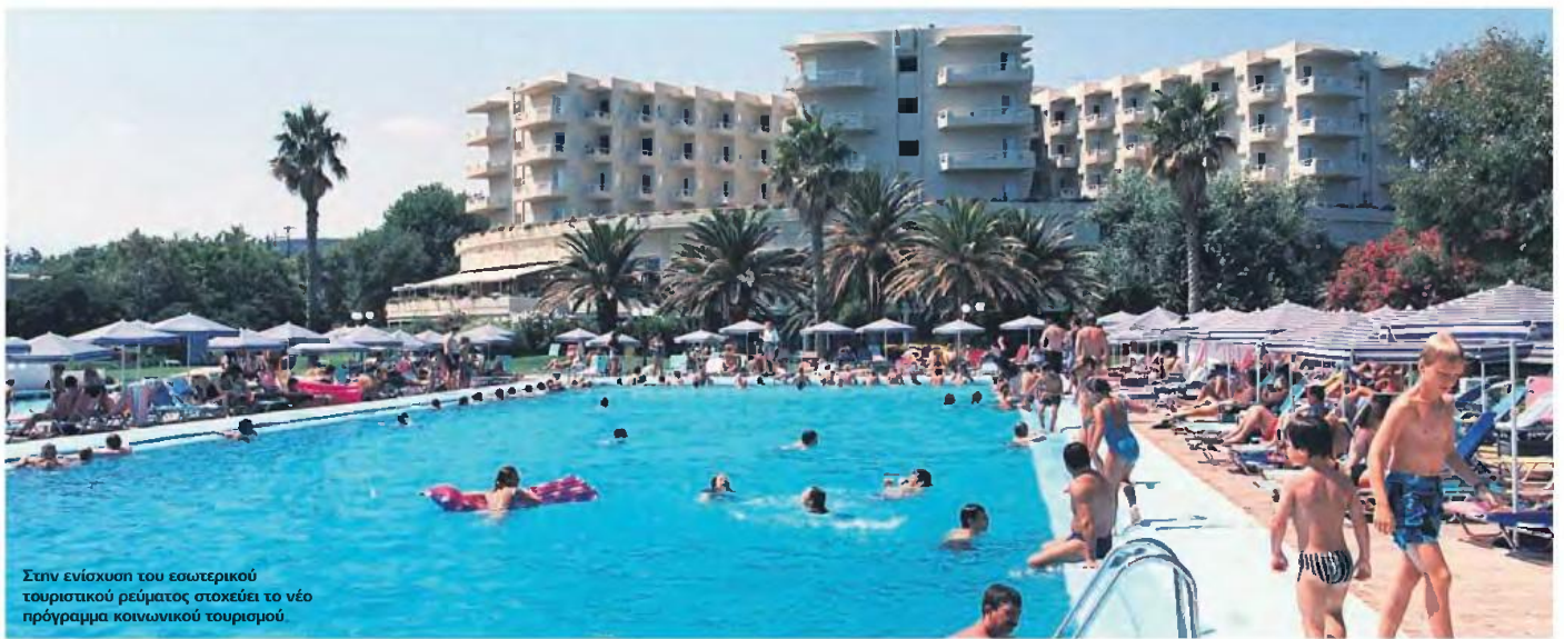
Στην ενίσχυση του εσωτερικού τουριστικού ρεύματος στοχεύει το νέο πρόγραμμα κοινωνικού τουρισμού.

ΚΟΙΝΩΝΙΚΟΣ ΤΟΥΡΙΣΜΟΣ ΓΙΑ ΧΑΜΗΛΑ ΕΙΣΟΔΗΜΑΤΑ ΚΑΙ ΤΗ ΜΕΧΡΙ ΤΩΡΑ «ΑΠΟΚΛΕΙΣΜΕΝΗ» ΜΕΣΑΙΑ ΤΑΞΗ