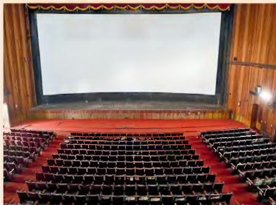
Την ειδική αποζημίωση θα πάρουν καλλιτέχνες ή επαγγελματίες της τέχνης με βραχυχρόνιες συμβάσεις εξαρτημένης εργασίας ορισμένου χρόνου.

Να σημειωθεί ότι έως την Κυριακή 17 Μαΐου μπορούν να υποβάλουν υπεύθυνες δηλώσεις σε ειδικό έντυπο στην ηλεκτρονική πλατφόρμα στήριξης των εργαζομένων supportemployees.services.gov.gr οι ειδικές κατηγορίες εργαζομένων που ήδη έχουν συμπεριληφθεί σε παλαιότερες υπουργικές αποφάσεις, για να λάβουν τα 800 ευρώ. Η αποπληρωμή της αποζημίωσης θα πραγματοποιηθεί σε δύο φάσεις, 13 και 14 Μαΐου και 18 και 19 Μαΐου, ενώ το διήμερο 14 και 15 Μαΐου θα πληρωθούν οι εργαζόμενοι των ειδικών περιπτώσεων που έχει ήδη ολοκληρωθεί η υποβολή αιτήσεων, όπως οι εργαζόμενοι σε επίσκεψη εργασίας, οι δανειζόμενοι εργαζόμενοι, οι εργαζόμενοι σε επιχείρηση που μεταβιβάστηκε κ.ά.