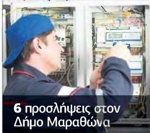
6 προσλήψεις στον Δήμο Μαραθώνα

μενοι μπορούν να αποστείλουν την αίτηση, καθώς και τα απαραίτητα δικαιολογητικά, αποκλειστικά: 1. με ηλεκτρονικό τρόπο στη διεύθυνση διοikit@volos-city.gr (για τη διευκόλυνση των υποψηφίων θα υπάρξει στην αρχική ιστοσελίδα του Δήμου Βόλου www.dimosvolos.gr η σχετική Αίτηση - Υπεύθυνη δήλωση συμμετοχής, σε επεξεργασμένη μορφή), 2. κατ' εξαίρεση ταχυδρομικά με συστημένη επιστολή στα γραφεία της υπηρεσίας στην ακόλουθη διεύθυνση: Δήμος Βόλου, Διεύθυνση Διοικητικών Υπηρεσιών, Τμήμα Διαχείρισης Ανθρώπινου Δυναμικού, κτίριο Δημοτικής Ενότητας Νέας Ιωνίας, Λεωφόρος Ειρήνης 131, Τ.Κ. 38446 Νέα Ιωνία (τηλ. επικοινωνίας: 24213 53118, 24213 53121, 24213 53124).