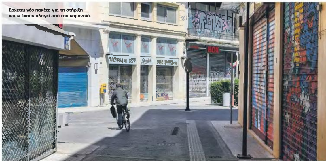
Ερχεται νέο πακέτο για τη στήριξη όσων έχουν πληγεί από τον κορονοϊό.

ΕΠΙΠΛΕΟΝ ΔΙΕΥΚΟΛΥΝΣΕΙΣ ΑΠΟ ΙΟΥΝΙΟ ΣΧΕΔΙΑΖΕΙ ΤΟ ΥΠΟΥΡΓΕΙΟ ΟΙΚΟΝΟΜΙΚΩΝ