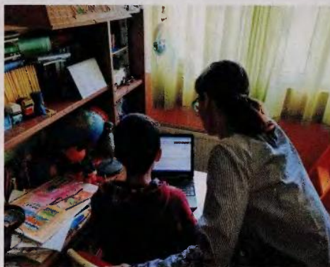
Ειδικά στις μικρότερες ηλικίες, ο γονέας έπρεπε να είναι δίπλα στο παιδί, να του εξηγήει πώς δουλεύει η πλατφόρμα, να καταλάβει και ο ίδιος πώς δουλεύει.