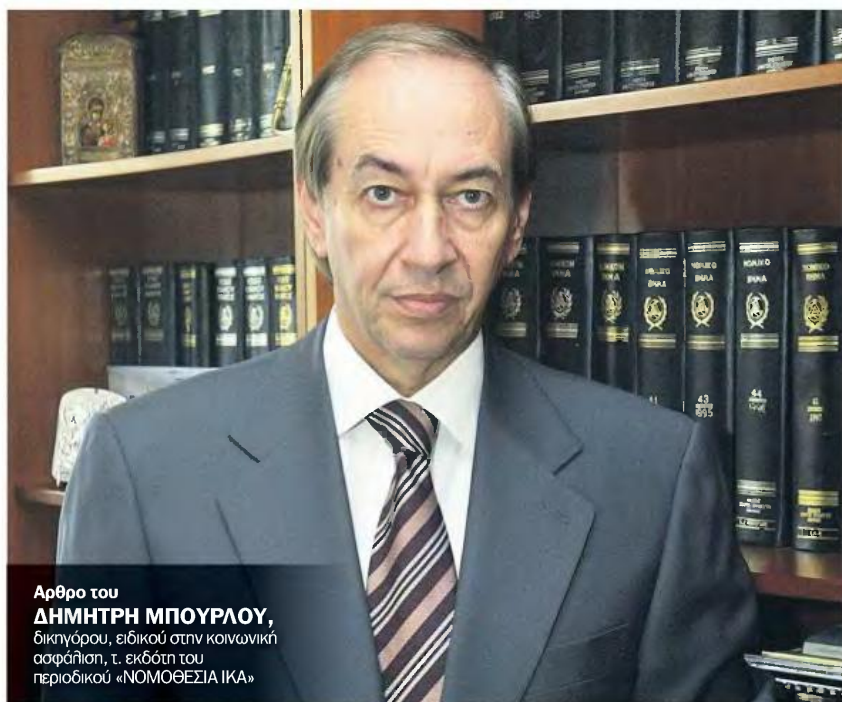
Άρθρο του ΔΗΜΗΤΡΗ ΜΠΟΥΡΑΛΟΥ, δικηγόρου, ειδικού στην κοινωνική ασφάλιση, τ. εκδότη του περιοδικού «ΝΟΜΟΘΕΣΙΑ ΙΚΑ»

Σύμφωνα με την πρόσφατη εγκύκλιο, στις περιπτώσεις εργασίας σε χώρα της Ε.Ε. η σύνταξη δεν περικόπεται. Αντίθετα, για εργασία σε