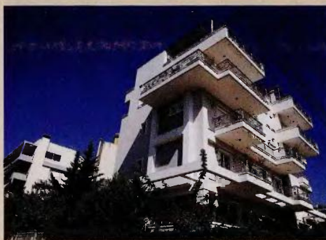
Σύμφωνα με τα στοιχεία του υπουργείου Οικονομικών, οι ιδιοκτήτες ακινήτων που έχουν εισοδήματα από αυτά ανέρχονται σε 1.560.000.

– Αφορολόγητα ενοίκια. Η ελάφρυνση να γίνει μέσω του φόρου εισοδήματος και συγκεκριμένα της κλίμακας φορολόγησης των εισοδημάτων από ενοίκια. Για τους μήνες που οι ιδιοκτήτες ακινήτων χάσουν το 40% του ενοικίου, θα προβλέπεται ότι το υπόλοιπο ποσό θα είναι αφορολόγητο. Οι ιδιοκτήτες ακινήτων θα κληθούν να υποβάλουν δήλωση «Ζημίας», ενδεχομένως αυτό να γίνει μέσω του εντύπου Ε2 (αναλυτική κατάσταση για μισθώματα ακινήτων) κατά τη συμπλήρωση των φορολογικών δηλώσεων το 2021 (εισοδήματα 2020), καθώς η μείωση αφορά εισο-