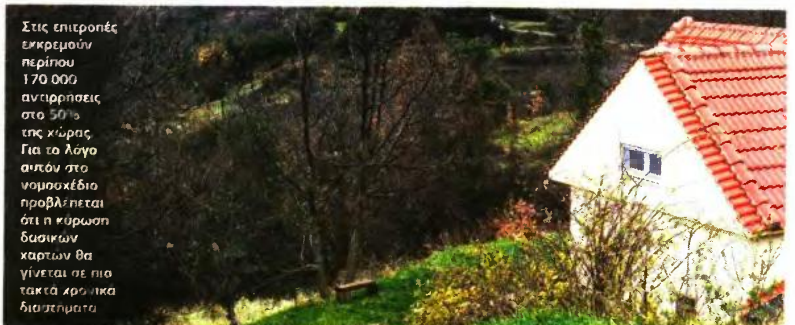
Στις επιτροπές εκκρεμούν περίπου 170.000 αντιρρήσεις στο 50% της χώρας. Για τα λόγια αυτών στο νομοσχέδιο προβλέπεται ότι η κύρωση των δασικών χαρτών θα γίνεται σε πιο τακτά χρονικά διαστήματα