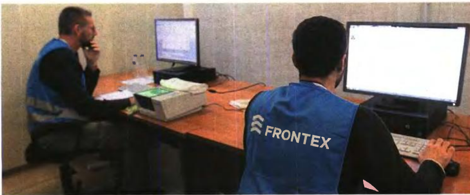
ΑΠΕ-ΜΠΕ ΟΡΙΣΤΗΣ ΠΛΗΡΗΣΙΟΥ