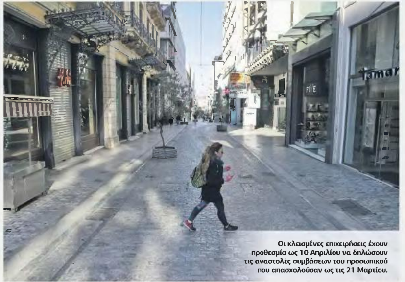
Οι κλεισμένες επιχειρήσεις έχουν προθεσμία ως 10 Απριλίου να δηλώσουν τις αναστολές συμβάσεων του προσωπικού που απασχολούσαν ως τις 21 Μαρτίου.

Για τους αυτοαπασχολούμενους ο υπουργός ξεκαθάρισε ότι παίρνουν 600 ευρώ για τον Απρίλιο και εντάσσονται στα 800 ευρώ για τον Μάιο (εφόσον υπάρχει κάρτα).