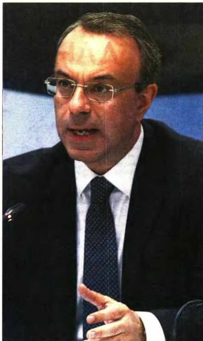
Ο υπ. Οικονομικών Χρήστος Σταϊκούρας ανακοινώνει τα μέτρα της κυβέρνησης

Σε πρώτη φάση οι αιτήσεις για την πρώτη αποζημίωση ειδί-