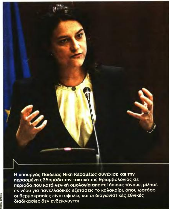
Η υπουργός Παιδείας Νίκη Κεραμιρέβα συνέχισε και την περασμένη εβδομάδα την τακτική της θριαμβολογίας σε περίοδο που κατά γενική ομολογία απαιτεί ήπιους τόνους, μίλησε εκ νέου για πανελλαδικές εξετάσεις το καλοκαίρι, όπου ωστόσο οι θερμοκρασίες είναι υψηλές και οι διαγωνιστικές εθνικές διαδικασίες δεν ενδείκνυνται

Την περασμένη εβδομάδα στο Κάνσας και στο Βερμόντ των ΗΠΑ ανακοινώθηκε επισήμως ότι η σχολική χρονιά τελειώνει, ενώ προς την ίδια απόφαση φαίνεται ότι κατευθύνεται και η Καλιφόρνια. Στην Ευρώπη οι συζητήσεις έχουν ανάψει, με κυρίαρχο το ερώτημα «ποιος θα στείλει τα παιδιά του σχολείου για 15 ημέρες ή έναν μήνα πριν από την επίσημη λήξη του έτους, με την πανδημία να μαί-