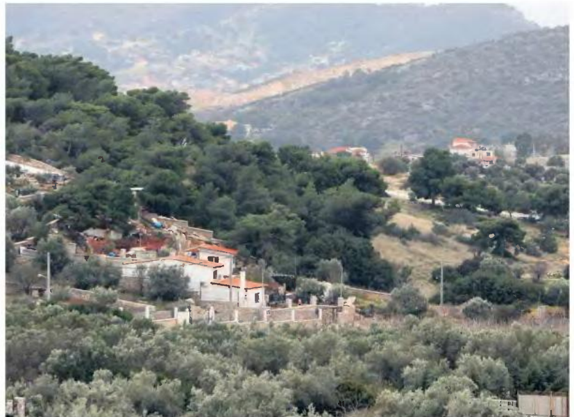
Για την ώρα, πάντως, η προθεσμία για τα αυθαίρετα εκκνέει στις 30 Ιουνίου.

Ε πί τάπητος έχει πέσει στην ηγεσία του υπουργείου Περιβάλλοντος η παράταση υπαγωγής των αυθαίρετων κτισμάτων, δεδωμένου των εξελίξεων που διαδραματίζονται στη χώρα λόγω του κορονοϊού.