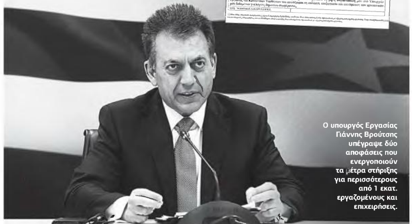
Ο υπουργός Εργασίας Γιάννης Βρούτσος υπέγραψε δύο αποφάσεις που ενεργοποιούν τα μέτρα στήριξης για περισσότερους από 1 εκατ. εργαζομένους και επιχειρήσεις.