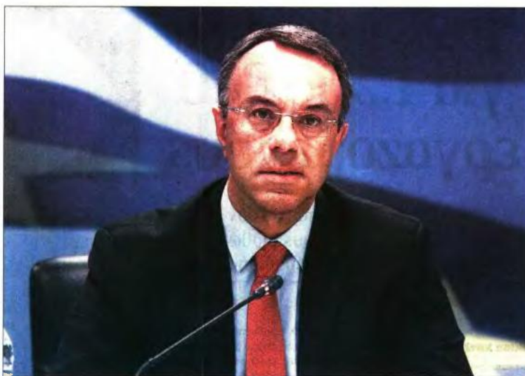
Ο υπουργός Οικονομικών Χρήστος Σταϊκούρας. Κάτω: Κλειστά καταστήματα στο Μοναστηράκι

Σύμφωνα με τον Χρήστο Σταϊκούρα, τα ταμειακά διαθέσιμα επαρκούν έως τις αρχές Ιουνίου, χωρίς να χρειαστεί να αξιοποιηθεί το λεγόμενο «μαξιλάρι ασφαλείας» ύψους 32 δις. ευρώ.