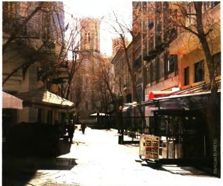
Οι κατηγορίες επιχειρήσεων που έκλεισαν λόγω αναγκαστικών μέτρων της κυβέρνησης ή που καταγράφουν μείωση του τζίρου μπορούν αν θέλουν να καταβάλουν το Δώρο έως το καλοκαίρι.

Στα μέτρα που νομοθέτησε η κυβέρνηση με την Πράξη Νομοθετικού Περιεχομένου που υπογράφηκε την Παρασκευή 20 Μαρτίου (ΦΕΚ Α 68) προβλέπεται η δυνατότητα μιας επιχείρησης να θέτει το 50% του προσωπικού της σε καθεστώς προσωπικού ασφαλείας για να αποφευχθεί η διασπορά του κορονοϊού. Επίσης, προβλέπεται η μεταφορά προσωπικού από μια εταιρεία σε άλλη εφόσον και οι δύο ανήκουν στον ίδιο όμιλο ή στον ίδιο εργοδότη και έχει επιβληθεί σε μία εκ των δύο ή περισσότερων δραστηριοτήτων το μέτρο της αναστολής λειτουργίας λόγω κορονοϊού. ■