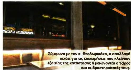
Σύμφωνα με τον κ. Θεοδωρικάκο, η απαλλαγή ισχύει για τις επιχειρήσεις που κλείνουν εξαιτίας της κατάστασης ή μειώνονται ο τζίρος και οι δραστηριότητές τους.

Συγκεκριμένα, για εισόδημα έως 12.000 ευρώ ο συντελεστής είναι 15%, από 12.001 έως 35.000 ευρώ είναι 35% και πάνω από 35.001 ευρώ είναι 45%. Όσον αφορά στην εισφορά αλληλεγγύης, αυτή -εφόσον ξεπεραστεί το αφορολόγητο των 12.000 ευρώ- επιβάλλεται με κλιμακωτό συντελεστή (2,2% για ετήσιο εισόδημα από 12.001 έως 20.000 ευρώ, 5% από 20.001 έως 30.000 ευρώ, 6,5% από 30.001 έως 40.000 ευρώ, 7,5% από 40.001 έως και 65.000 ευρώ, 9% από 65.001 έως και 220.000 ευρώ και 10% από 220.001 ευρώ και πάνω). ■