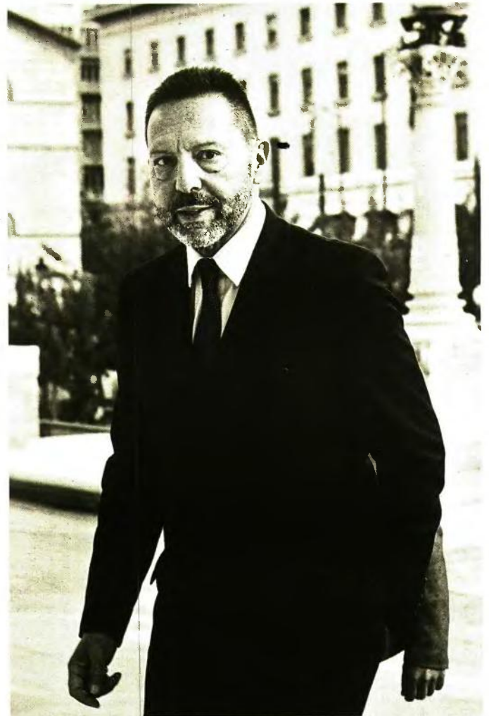
Μέτρα για τη διευκόλυνση των δανειοληπτών αποφασίστηκαν στις συνεχείς συσκέψεις του διοικητή της ΤτΕ, Γ. Στουρνάρα, με τους εκπροσώπους των τραπεζών.

«Το μέτρο θα ισχύσει για συνεπείς επιχειρήσεις σε κλάδους οι οποίοι πλήττονται από την πανδημία, όπως ο τουρισμός και η εστίαση. Η αγορά των σούπερ μάρκετ, για παράδειγμα, δεν αντιμετωπίζει πρόβλημα ρευστότητας, μιας και τα κέρδη τους έχουν εκτοξευτεί λόγω του ιού», καταλήγουν. ■