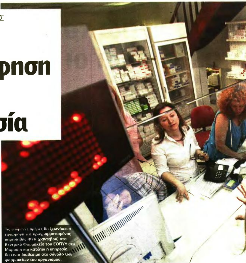
Τις επόμενες ημέρες θα ξεκινήσει η εφαρμογή της προγραμματισμένης παραλαβής ΦΥΚ (ραντεβού) στο Κεντρικό Φαρμακείο του ΕΟΠΥΥ στο Μαρούσι και κατόπιν η υπηρεσία θα είναι διαθέσιμη στο σύνολο των φαρμακείων του οργανισμού.

► Αναστέλλεται προσωρινά για ένα μήνα η λειτουργία των Επιτροπών Εξωσωματικής Γονιμοποίησης του ΕΟΠΥΥ. ■