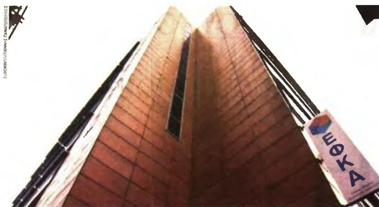
Το 27,3% των αυτοαπασχολούμενων που είναι ασφαλισμένοι στον ΕΦΚΑ επέλεξε μεταξύ 2ης και 6ης ασφαλιστικής κατηγορίας.