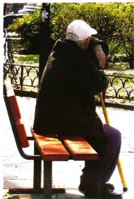
Ποιά σύνταξη μετά τις ασφαλιστικές κρατήσεις και πριν από τον φόρο.