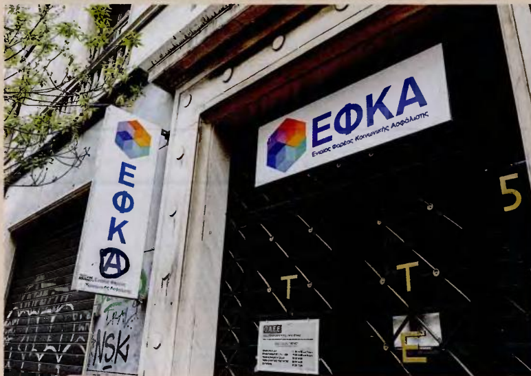
Ελεύθερος επαγγελματίας με εισόδημα 25.000 ευρώ, εφόσον πληρώσει υψηλές εισφορές για περισσότερα από 35 χρόνια, θα λάβει σύνταξη που θα είναι κατά 10% υψηλότερη από τις εισφορές που θα έχει καταβάλει στον ΕΦΚΑ.

– Ελεύθερος επαγγελματίας που δηλώνει επίσης εισόδημα 25.000 ευρώ, αν επιλέξει την 1η ασφαλιστική κατηγορία, εισφέρει 2.460 ευρώ στον ΕΦΚΑ και 3.811 ευρώ στο Δημόσιο για φόρο. Στην πράξη, στον ασφαλισμένο καταλύει το 74,9% του εισοδήματός του έναντι 25,1% που εισφέρεται στο Δημόσιο. Στην περίπτωση που επιλέξει την υψηλότερη κατηγορία, τότε θα καταβάλει 6.720 ευρώ για εισφορές και 2.722 ευρώ σε φόρο (ήτοι θα του μείνει το 62,2% του εισοδήματος, ενώ το 37,8%