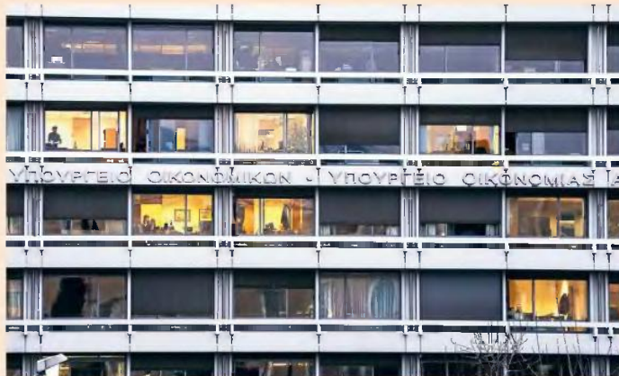
Πηγές του υπουργείου Οικονομικών θεωρούν σίγουρο ότι θα καταγραφεί από τον Μάρτιο και τους επόμενους μήνες καθίζηση των δημοσίων εσόδων και των ασφαλιστικών εισφορών.

Δεν είναι όμως μόνο οι ψηφισθέντες νόμοι και εξαγγελίες που απαιτούν αναδιοργάνωση. Είναι άγνωστο αυτή τη στιγμή εάν μπορεί να ανοίξει το σύστημα Taxis για την υποβολή των φορολογικών δηλώσεων, αλλά το κυριότερο ουδείς μπορεί να γνωρίζει το πότε θα κλείσει. Παράγον του υπουργείου Οικονομικών σημειώνει ότι στην παρούσα φάση το ζητούμενο δεν είναι το πότε θα ξεκινήσει η διαδικασία υποβολής των δηλώσεων και αν θα ανοίξει το ηλεκτρονικό σύστημα στα τέλη Μαρτίου, αλλά το πότε θα υποβληθούν οι δηλώ-