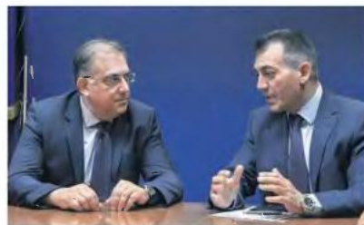
Μέτρα για την προστασία των εργαζομένων σε δημόσιο και ιδιωτικό τομέα υποθέτουν οι αρμόδιοι υπουργοί Εργασίας Γιάννης Βρούτσος και Εσωτερικών Τάκης Θεοδωρικάκος.