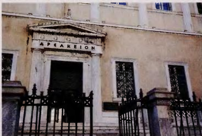
Η Ολομέλεια του ΣτΕ έχει κρίνει ότι η διάταξη της προηγούμενης κυβέρνησης (ν. 4389/16) για τις οικιστικές πυκνώσεις είναι αντισυνταγματική.

Η «πατρότητα» της ρύθμισης ανήκει στον (αναπληρωτή υπουργό Περιβάλλοντος το 2016) Γιάννη Τσιρώνη. Όπως προβλέπει, για τον χαρακτηρισμό μιας ομάδας αυθαιρέτων ως «οικιστική πυκνώση» χρειάζονταν κατ' ελάχιστον 50 κτίρια σε έκταση 25 στρεμμάτων. Ο ορισμός δεν έθετε κριτήρια ως προς την πυκνότητα ή την ελάχιστη απόσταση των κτιρίων, με αποτέλεσμα πολλοί δήμοι να