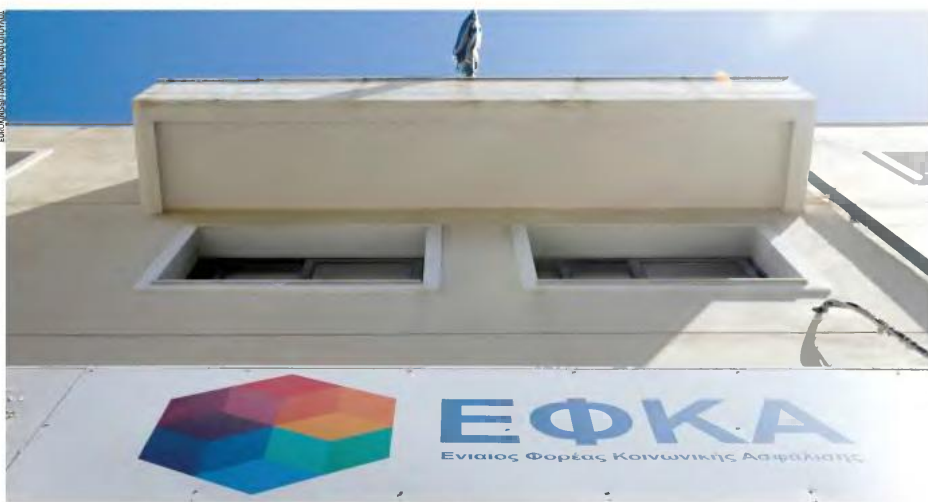
Δράσεις για ολοκλήρωση της ψηφιοποίησης των υπηρεσιών του νέου e-ΕΦΚΑ περιλαμβάνονται στο ασφαλιστικό νομοσχέδιο.

«Δεύτερη ευκαιρία» σε τουλάχιστον 50.000 ασφαλισμένους που έχασαν τη ρύθμιση των 120 δόσεων δίνει διάταξη του ασφαλιστικού νομοσχεδίου, η οποία προβλέπει ότι οι οφειλέτες που έχασαν τη συγκεκριμένη ρύθμιση μπορούν να υποβάλουν αίτηση επανένταξης μέχρι τις 31 Μαρτίου του 2020. Η βασική προϋπόθεση για την επανένταξη στη ρύθμιση ασφαλιστικών οφειλών των 120 δόσεων είναι οι οφειλέτες που θα επιλέξουν να ενταχθούν ξανά να καταβάλουν όλες τις δόσεις που έγιναν απαιτητές, καθώς και τις νέες βεβαιωμένες οφειλές που έχουν και δεν ήταν μέσα στην αρχική ρύθμιση. Η δυνατότητα αυτής της «δεύτερης ευκαιρίας» θα γίνεται έπειτα από σχετική αίτηση του οφειλέτη στις αρμόδιες υπηρεσίες του ΚΕΑΟ.