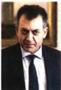
Ο υπουργός Εργασίας, Γιάννης Βρούτσης, ενημέρωσε χθες την κοινοβουλευτική ομάδα της Ν.Δ. για τους βασικούς άξονες του σχεδίου νόμου.

Στη Βουλή αναμένεται να καταβεί εντός της ημέρας, σύμφωνα με τον αρχικό σχεδιασμό του υπουργείου Εργασίας, το νέο ασφαλιστικό νομοσχέδιο, με στόχο να ψηφιστεί έως τις 21 του μήνα. Εν όψει της επικείμενης κατάθεσής του στη Βουλή, χθες ο αρμόδιος υπουργός, Γιάννης Βρούτσης, ενημέρωσε την κοινοβουλευτική ομάδα της Ν.Δ. για τους βασικούς άξονες του σχεδίου νόμου, το οποίο, λόγω των ρυθμίσεων που περιέχει, αναμένεται να αλλάξει το ασφαλιστικό τοπίο της χώρας. Οι αλλαγές που περιλαμβάνει στα 104 άρθρα του αφορούν περίπου 4 εκατ. άτομα, εργαζόμενους και συνταξιούχους.