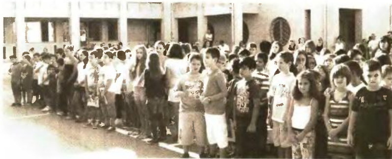
Περισσότερα κατά 270 θα είναι από το νέο έτος τα πρωτακία στα Γυμνάσια

Ωστόσο όπως επεσήμανε ο ίδιος, η αύξηση του μαθητικού δυναμικού θα είναι πρόσκαιρη. Από το επόμενο σχολικό έτος η δευτεροβάθμια εκπαίδευση Μαγνησίας θα ξεκινήσει να δέχεται τα επανομαζόμενα «παιδιά της κρίσης». Πρόκειται για παι-