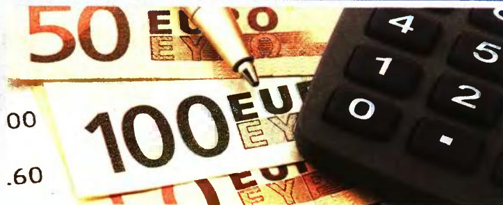
Ο ΝΕΟΣ ΧΑΡΤΗΣ ΤΩΝ ΣΥΝΤΑΞΕΩΝ

3 Με 38 έτη και συντάξιμο μισθό 2.050 ευρώ, νέα σύνταξη 1.305 ευρώ με αύξηση 121 ευρώ από τα 1.184 ευρώ που έχει σήμερα. 4 Με 40 έτη και συντάξιμο μισθό 3.550 ευρώ, νέα σύνταξη 2.159 ευρώ με αύξηση 256 ευρώ από τα 1.903 ευρώ σήμερα. 5 Με 40 έτη και συντάξιμο μισθό 4.000 ευρώ, σύνταξη 2.384 ευρώ με αύξηση 288 ευρώ από τα 2.096 ευρώ σήμερα.