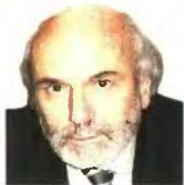
Του Αλεξάνδρου Π. Κωστάρα Ομότιμου Καθηγητή Νομικής Σχολής Πανεπιστημίου Θράκης

«Ο κυοφορούμενος είναι «Έλληνας πολίτης». Μέσα και έξω από την Ελλάδα. Δεν μπορεί να θεωρείται «Έλληνας πολίτης» όταν βρίσκεται εκτός των ορίων της Ελληνικής Επικρατείας, αλλά να αντιμετωπίζεται ως «υλικό» ονόμου, όταν διαμένει εντός αυτής.