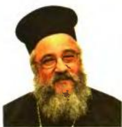
Του Αρχιεπισκόπου Σωφρόνιου Γκουτζίνη Πρωτοσύγκελλος Ιεράς Μητροπόλεως Ξάνθης και Περιθεωρίου