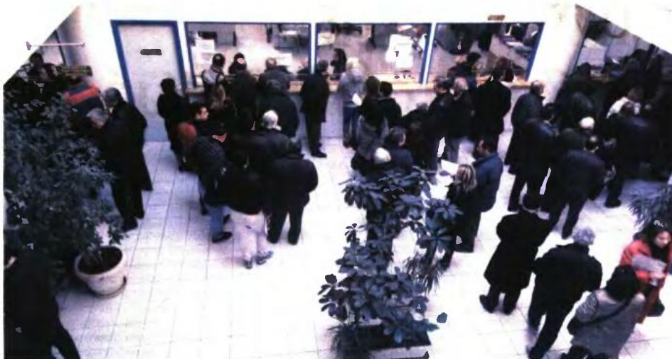
Στη νέα πάγια ρύθμιση μπορούν να ενταχθούν και οι φορολογούμενοι οι οποίοι χρωστούν φόρο εισοδήματος, ΕΝΦΙΑ, ΦΠΑ και άλλους φόρους και τέλη υπέρ του Δημοσίου που βεβαιώθηκαν στα ονόματά τους εντός του 2019 αλλά δεν είχαν εντάξει τις συγκεκριμένες οφειλές στην πάγια ρύθμιση των 12 δόσεων.

κωτό συντελεστή, όπως αυτός ορίζεται στο ένατο εδάφιο υποπερίπτωσης β της περίπτωσης 1 της υποπαραγράφου Α2 της παραγράφου Α του άρθρου πρώτου του ν. 4152/2013, όπως τροποποιήθηκε με την παράγραφο 1 του άρθρου 43 του ν. 4646/2019. Το άθροισμα των γινόμενων των ακαθάριστων εσόδων με τους αντίστοιχους συντελεστές αναγόμενο σε μηνιαία βάση διαιρείται το ποσό της ρυθμιζόμενης οφειλής. Ο αριθμός των δόσεων προκύπτει από το ακέραιο μέρος του πηλίκου της διαίρεσης αυτής, υπό τον περιορισμό του ελάχιστου ποσού μηνιαίας δόσης. Σε περίπτωση που για όλα τα φορολογικά έτη με βάση τα οποία καθορίζεται η ικανότητα αποπληρωμής του οφειλέτη έχουν υποβληθεί μηδενικές δηλώσεις φορολογίας εισοδήματος, χορηγείται ο μέγιστος αριθμός δόσεων, υπό τον περιορισμό του ποσού της ελάχιστης μηνιαίας δόσης. Για τον καθορισμό της ικανότητας αποπληρωμής λαμβάνονται κάθε φορά υπ' όψιν και οι οφειλές από ανεξόφλητες κατά τον χρόνο της υπαγωγής δόσεις ρυθμιζόμενων οι οποίες χορηγήθηκαν δυνάμει των διατάξεων της υποπερίπτωσης α' (ii), στον βαθμό που ο χρόνος αποπληρωμής των δόσεων των προηγούμενων ρυθμίσεων συμπίπτει με τον χρόνο αποπληρωμής των δόσεων της ρύθμισης. Αν το νομικό πρόσωπο ή η νομική οντότητα έχει προβεί σε διακοπή εργασιών, ως συνολικά ακαθάριστα έσοδα για τον υπολογισμό του αριθμού των δόσεων λαμβάνονται υπ' όψιν τα συνολικά ακαθάριστα έσοδα του φορολογικού έτους διακοπής εργασιών. Σε περίπτωση που το