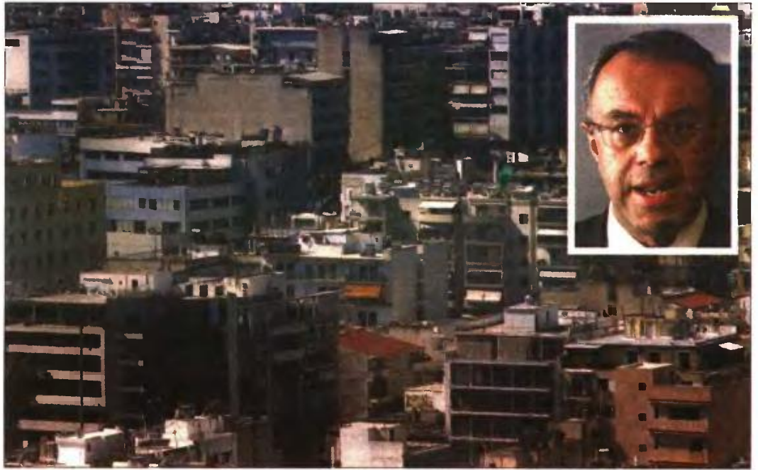
Πάνω δεξιά: Ο υπουργός Οικονομικών Χρ. Σταϊκούρας