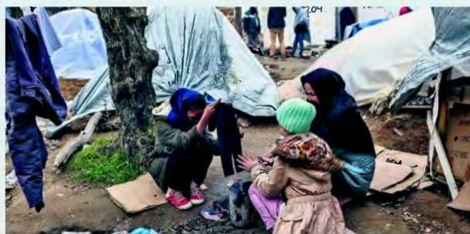
►► ΠΡΟΒΛΗΜΑ ΜΕ ΤΟΥΣ ΑΦΓΑΝΟΥΣ ΜΕΤΑΝΑΣΤΕΣ