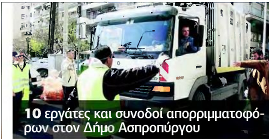
10 εργάτες και συνοδοί απορριμματοφόρων στον Δήμο Ασπροπύργου

(για την κεντρική του υπηρεσία και τις περιφερειακές του οργανικές μονάδες, που εδρεύουν στους Νομούς Θεσσαλονίκης, Πέλλας και Ημαθίας) και συγκεκριμένα του εξής, ανά υπηρεσία, έδρα, ειδικότητα και διάρκεια σύμβασης, αριθμού ατόμων: Οι ενδιαφερόμενοι καλούνται να συμπληρώσουν την αίτηση με κωδικό έντυπο ΓΟΕΒ ΣΧΟΧ 1 και να την υποβάλουν σε κλειστό φάκελο στον οποίο να αναγράφονται το ονοματεπώνυμο και οι κωδικοί θέσης είτε αυτοπροσώπως είτε με άλλο εξουσιοδοτημένο από αυτούς πρόσωπο, εφόσον η εξουσιοδότηση φέρει την υπογραφή τους θεωρημένη από δημόσια Αρχή, στην Κεντρική Υπηρεσία, 26 η Οκτωβρίου 43 - Θεσσαλονίκη (υπ' όψιν Σ. Μαυροπούλου, με αναπληρώτρια τη Δ. Γορδάρη, τηλ. 2310543860) από 08.00 έως 14.00. ■