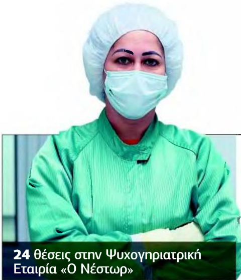
24 θέσεις στην Ψυχογериατρική Εταιρία «Ο Νέοτωρ»