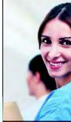
69 γιατροί στον Εθνικό Οργανισμό Δημόσιας Υγείας

► Ο Εθνικός Οργανισμός Δημόσιας Υγείας, στο πλαίσιο του προγράμματος με τίτλο «Ολοκληρωμένη επείγουσα παρέμβαση υγείας για την προφυγική κρίση», ανακοινώνει τη σύναψη σύμβασης μίσθωσης έργου με 69 άτομα για 6 μήνες, ως ακολούθως: 63 ΠΕ Ιατροί, 6 ΠΕ Ψυχολόγοι. Οι ενδιαφερόμενοι μπορούν να υποβάλουν την αίτηση εκδήλωσης ενδιαφέροντος (σε κλειστό φάκελο) στη Γραμματεία του ΕΟΔΥ, Αγράφων 3-5, Μαρούσι, Τ.Κ. 15123. Πληροφορίες: τηλ. 2105212000 www.eody.gov.gr