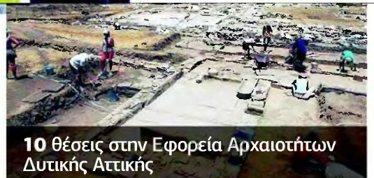
10 θέσεις στην Εφορεία Αρχαιοτήτων Δυτικής Αττικής